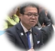
はまぐち 謙 参議院議員