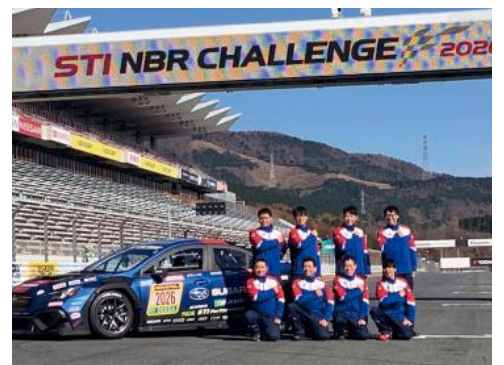
コース場での全体集合写真