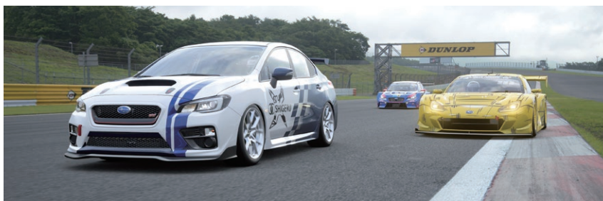
SG eSPORTSで参戦した際のオリジナルラリー車両