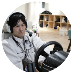
企業交流戦時の様子