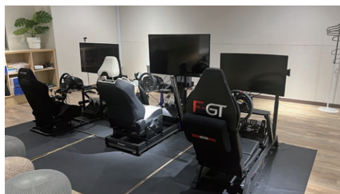
しげる工業のeSPORTS基材と環境