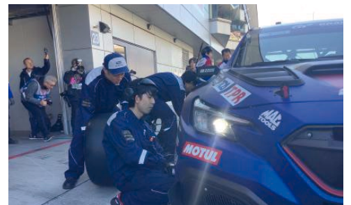
仕事同様にタイヤ脱着も正確にこなしています!