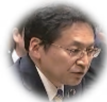
いそざき 哲史 参議院議員

そもそも、なんでガソリン暫定税率って始まったの?なんで50年も変わらなかったの?