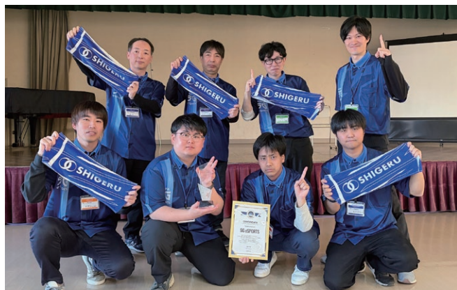
GMTC'25 授賞式の集合写真。(チーム戦優勝)

SG eSPORTS部のこれからの活動を応援していただくとともに、eSPORTSの活動をしている企業がありましたら是非お声がけいただき新しいつながりを創っていきましょう!!